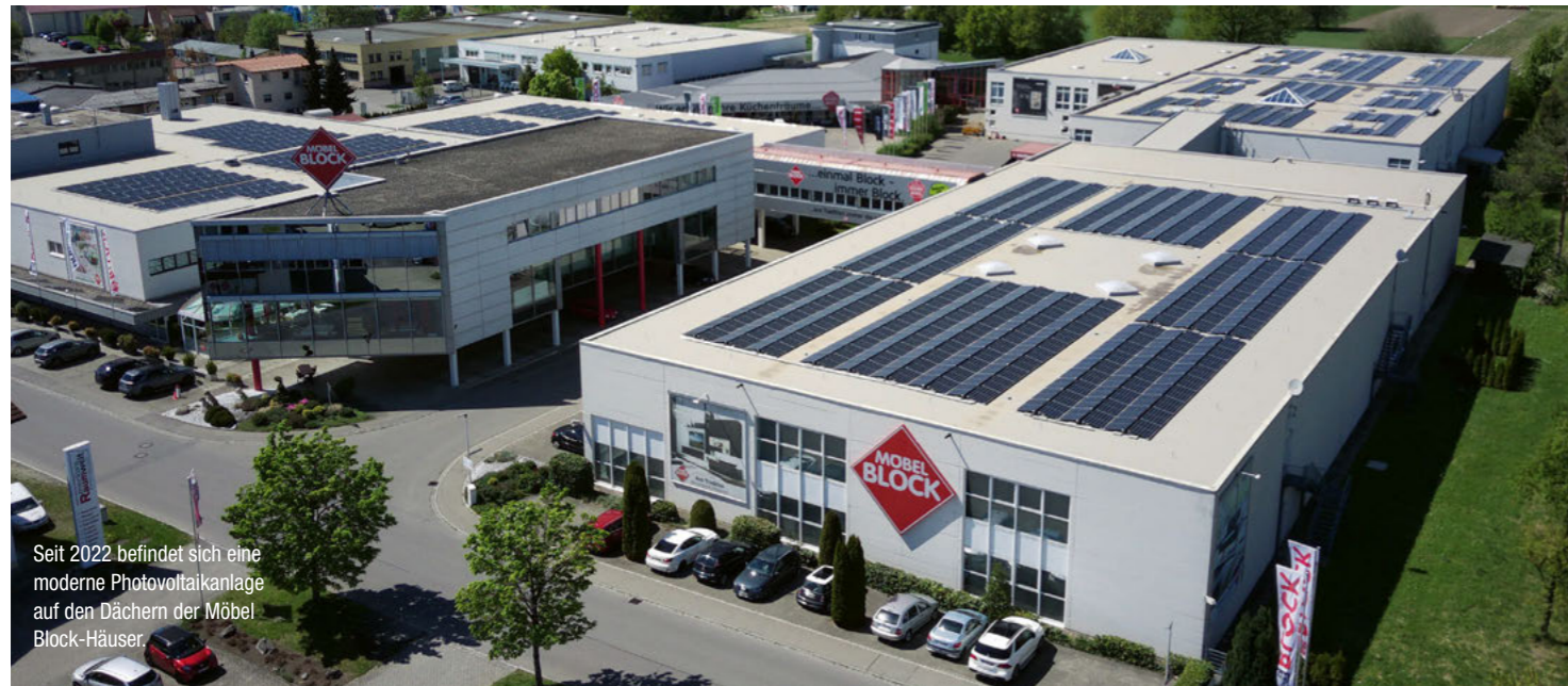
Seit 2022 befindet sich eine moderne Photovoltaikanlage auf den Dächern der Möbel Block-Häuser.

Das Wort „Stillstand“ scheint bei Möbel Block am Bodensee nicht zu existieren. Darauf lässt zumindest die Chronik des traditionsreichen Familienunternehmens schließen. Aber nicht nur in der Vergangenheit hat sich beim Möbelfachgeschäft aus Meckenbeuren viel getan. Mit Investitionen in den umfangreichen Umbau der Häuser stärkt die Firma aktuell und zukünftig gezielt den stationären Handel. Laut Firmenphilosophie setzt Block dabei auch einen Schwerpunkt auf Nachhaltigkeit.